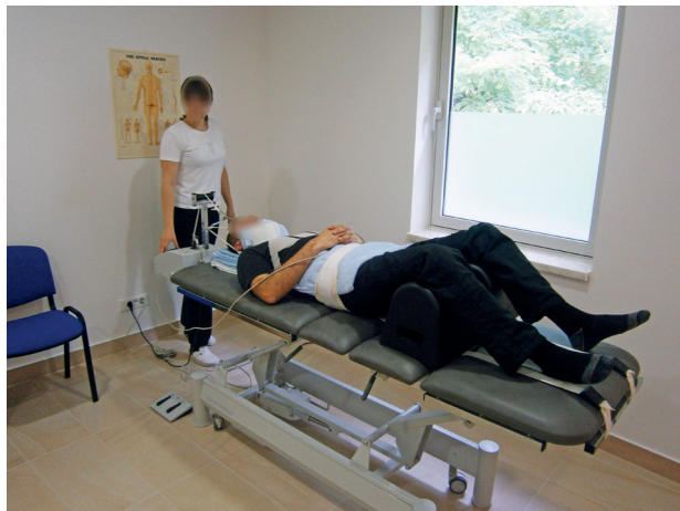
Slika 1. Dekompresijska terapija cervikalne kralježnice

S obzirom na to da je ova vrsta terapije relativno rijetka u Hrvatskoj, a istraživanja nisu provedena, smatrali smo shodnim provjeriti djelotvornost navedene terapije u našim uvjetima pa je cilj ovog istraživanja provjeriti